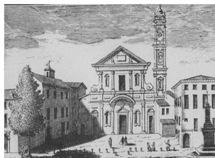
L'antico laghetto alle spalle di S. Stefano, sullo sfondo il Duomo